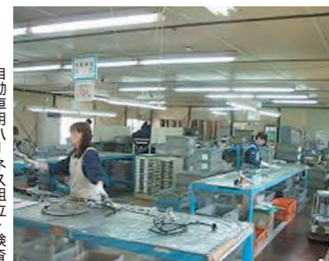
自動車用ハーネス組立・検査